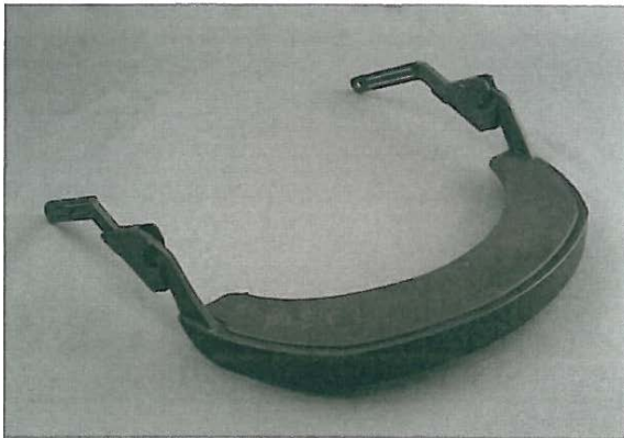
Safe 2 visor carrier FLEX Low Peak 20901-510