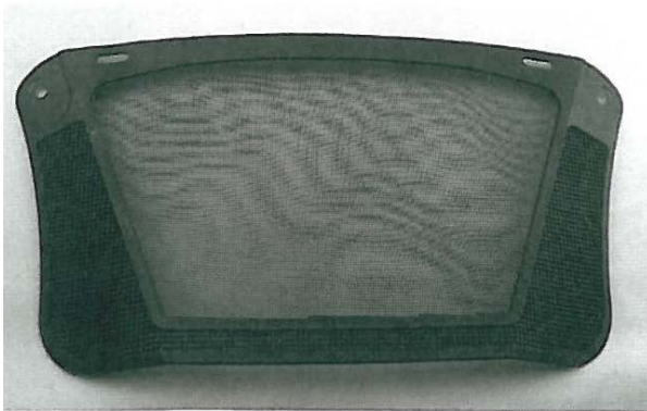
Hellberg SAFE H20923