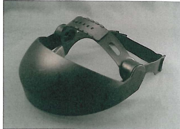
Safe 3 browguard 61100