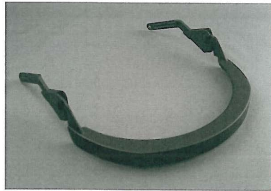
Safe 2 visor carrier Standard Low Peak 20901-010

Fín del certificabo de exámen EC 11297BES01